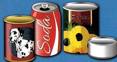
Vacíe y enjuague