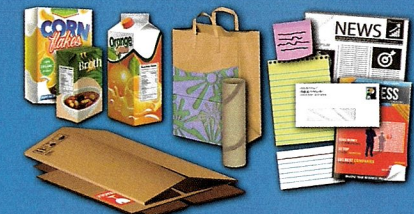
Aplane el cartón